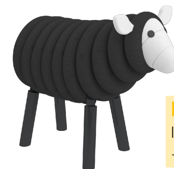
Farbvariante 4 lasiert in RAL 9004 Signalschwarz + RAL 9003 Signalweiß