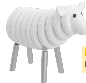
Farbvariante 2 lasiert in RAL 9003 Signalweiß