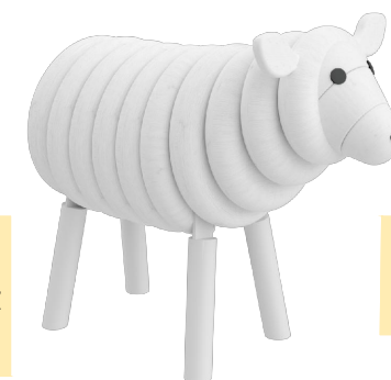
Farbvariante 5 lasiert in RAL 9003 Signalweiß