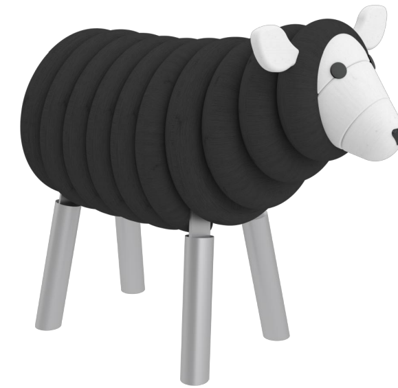
Farbvariante 1 lasiert in RAL 9004 Signalschwarz + RAL 9003 Signalweiß