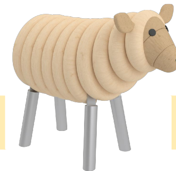
Farbvariante 3 lasiert in Eiche hell