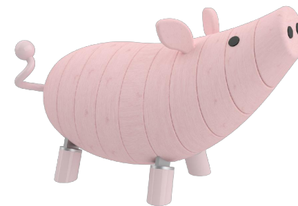
Farbvariante 3 lasiert in RAL 3015 Hellrosa