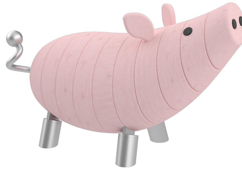
Farbvariante 1 lasiert in RAL 3015 Hellrosa