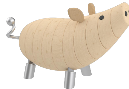
Farbvariante 2 lasiert in Eiche hell