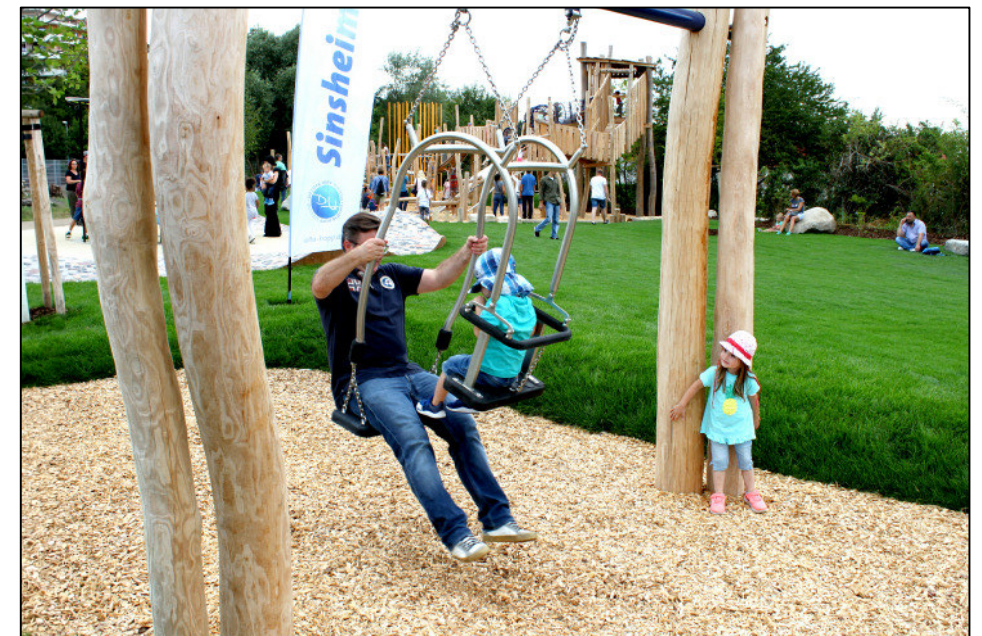
Schaukelsitz Groß und Klein

Maximale freie Fallhöhe des Gerätes: 1,90m Altersgruppe: von 1 bis 99 Jahren Diese Zeichnung ist Eigentum der Firma: ESF Emsland Spiel- und Freizeitgeräte GmbH & Co. KG Thyssenstraße 7, 49744 Geeste Tel: 05937/ 97189-0 ; Fax: 05937/ 97189-90 Alle Rechte sind bei den Autoren. Diese Unterlagen dürfen nicht ohne Zustimmung der o. g. Firma in den Ausschreibungen verwendet werden. Der nicht autorisierte Nachbau ist kostenpflichtig.